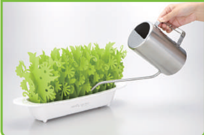
※1 室温 20℃ 湿度 30%の条件下にて、コップ1杯 (φ52) との比較

加湿量 (=自然蒸発量) は コップ 1 杯の自然蒸発量の 約 40 倍以上※1