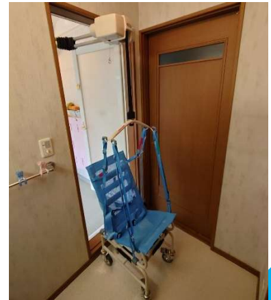
リフト脱衣所へ転回