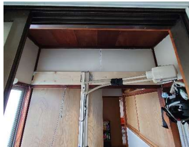
下り壁を補強して取付

居住地域 栃木県真岡市 ご利用者 娘様 主介助者 お父様/ヘルパー様 導入場所 脱衣室 建物構造 木造軸組 所有形態 ご家族所有 検討経緯 筋力が低下する病気の為自力で立ち上がる事が難しくなってきました。先行して導入したトイレ用とベッド用リフトがとても上手く使用出来ている為、脱衣室にリフトを設置すれば、シャワー浴も自立できると導入を決定。