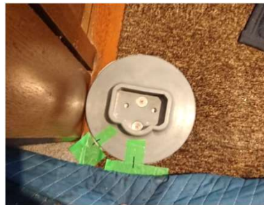
カーペット丸カット

居住地域 神奈川県横浜市 ご利用者 娘様 主介助者 お母様/ヘルパー様 導入場所 リビング 建物構造 鉄骨造 所有形態 自己所有 助成金 横浜市住環境整備事業 100万円/1ヶ所 検討経緯 脳性まひで何とか抱きか かえ介助で立ち上がり、 歩行介助をしておりまし たが、体重が70kg近くな り、介助量が増えた為。