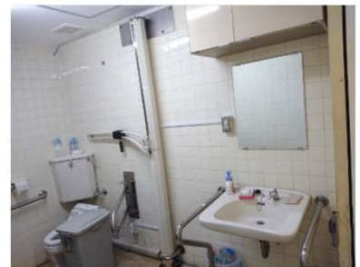
旧型リフト設置状況