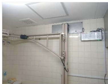
取付部・電源 入替後